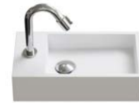
SOLID SURFACE 400